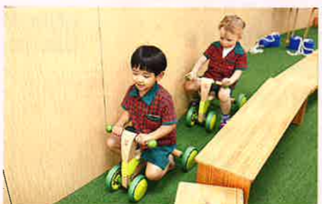
▲ 課堂間會讓學生在indoor garden內遊玩，他們可隨意享用當中的設備。