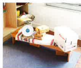
課程中提及郵政局與寄信，從而教授寶貴輕與重的概念。

生的事，也會成為學生的學習主題，如上課時，因有蜜蜂飛入教室之中，令學生非常感興趣，想知道「蜜蜂為甚麼飛進來？」、「讓蜜蜂蜇倒會怎樣？」等，使老師以此為出發點，擴展出相關的內容。伊頓就是利用創新的教學、開放性的學習資源和材料，創造一個利於學生探索、研究和培養他們終生熱愛學習的環境。