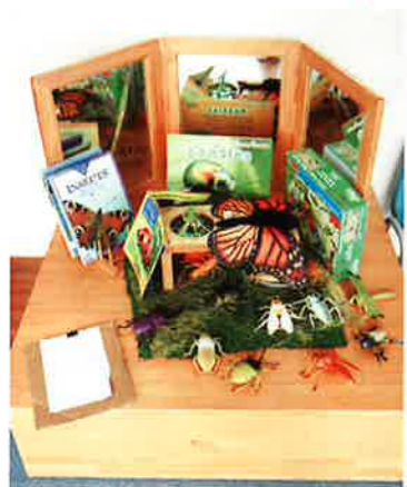
學會觀察其他昆蟲