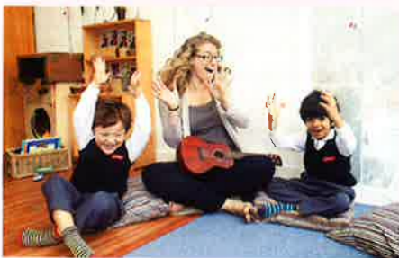
▲ 上課時老師會運用樂器和學生唱遊，令他們玩得不亦樂乎。