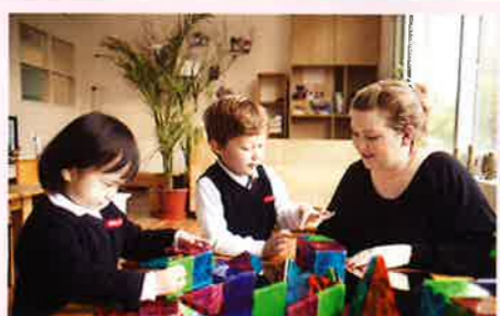
▲ 學生們和老師正進行研討及製作主題作業。