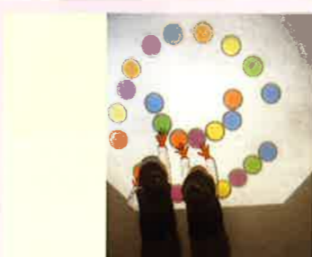
▲ 利用投影機、彩色膠片、立體幾何模型，讓學生在富有趣味性的教具下，了解平面與立體的關係。