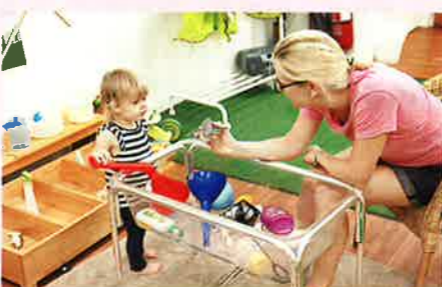
▲ 學校設有水池和沙池，讓學生可以多接觸沙和水，更提供不同的工具去學習。