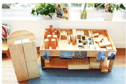
學習建築物會用不同的形狀建成，如蜂巢的六角形