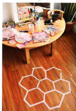
知道蜂巢的形狀而學會圖形